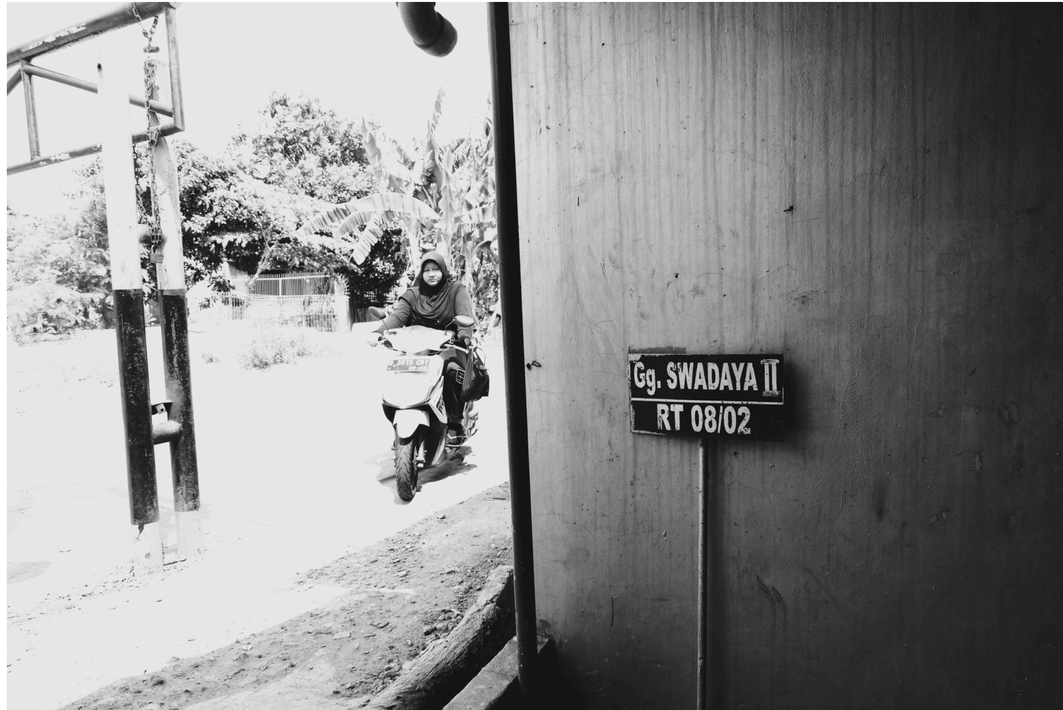
Antara jalan buntu dan perspektif baru.