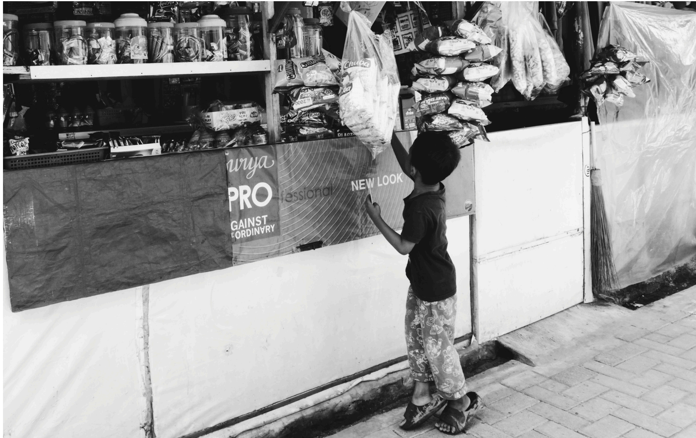
Coklat? Permen? Ciki?