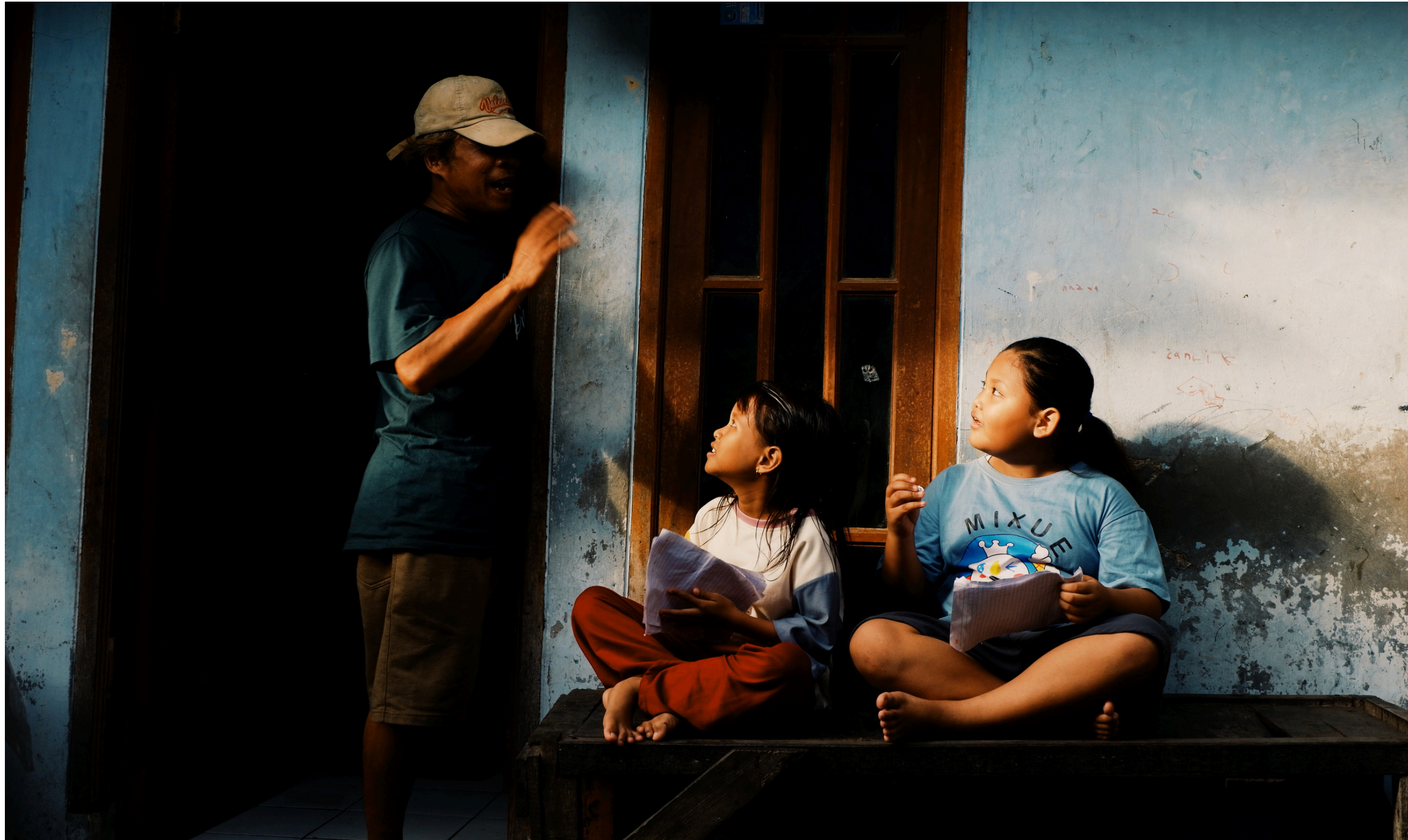
Bersama, tapi meracuni.