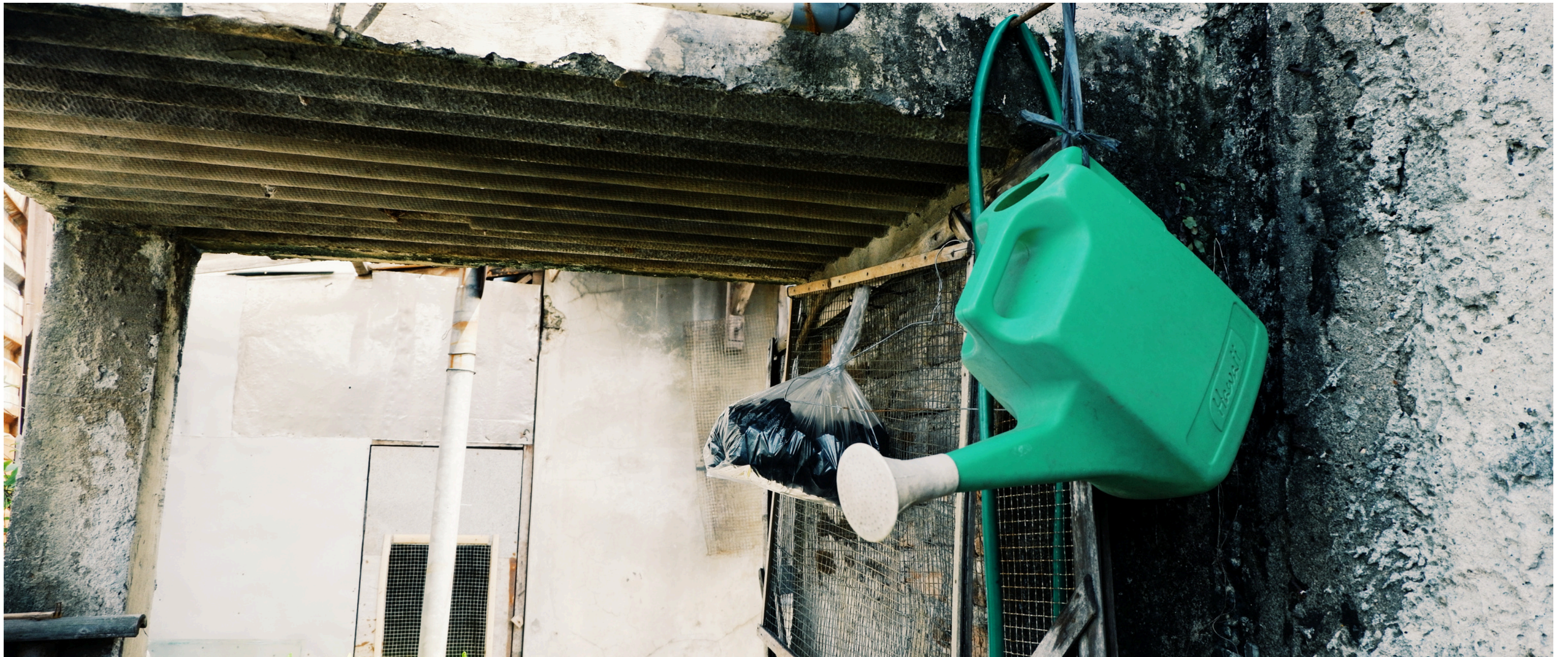
Air dan api.