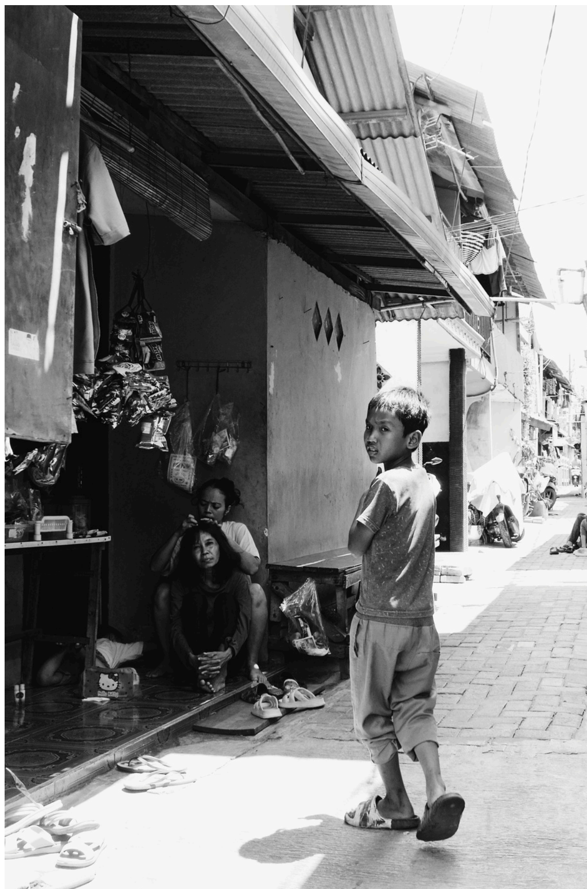
Sepasang bahu untuk bersandar, dan sepasang telinga untuk saling mendengar