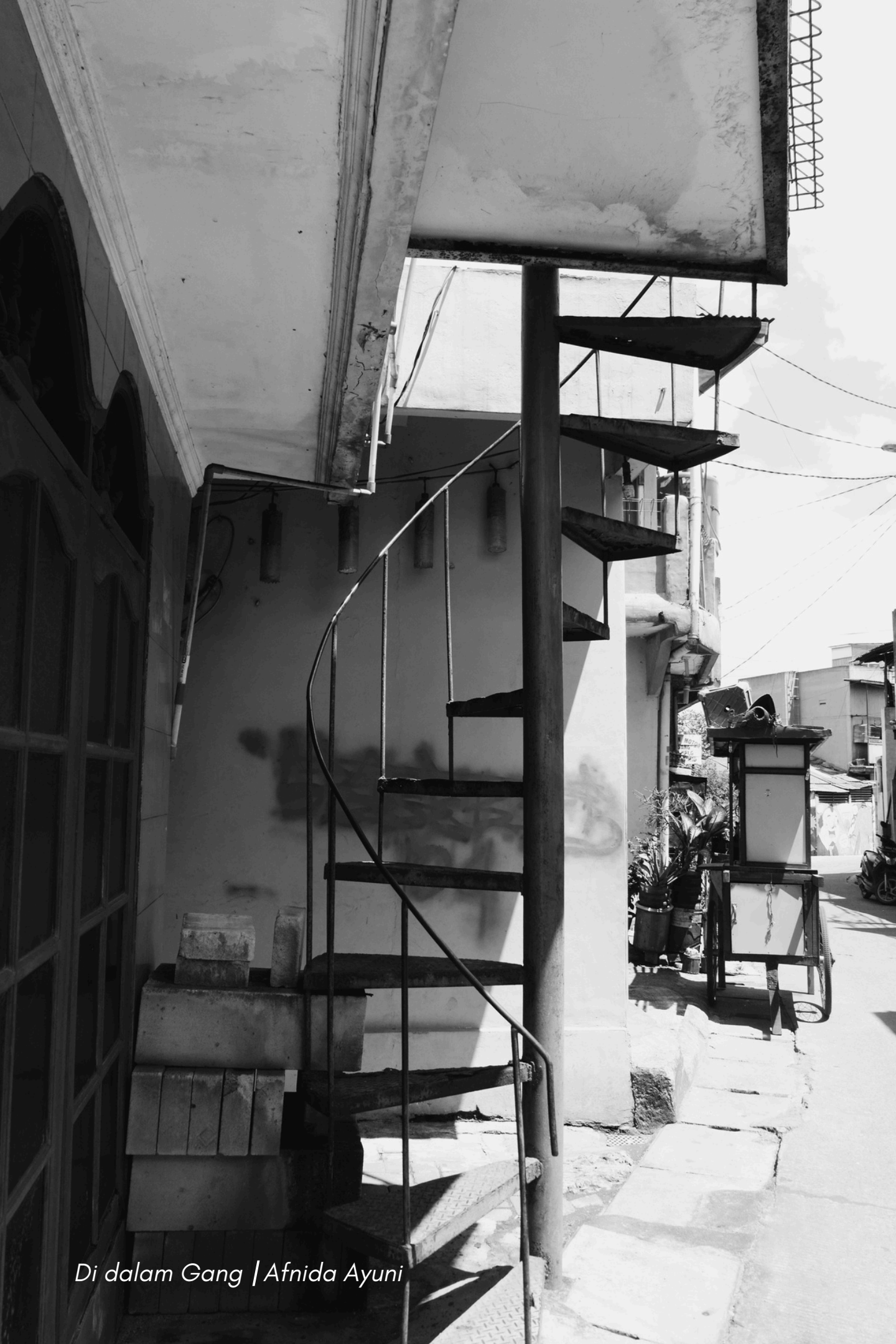
Di dalam Gang | Afnida Ayuni