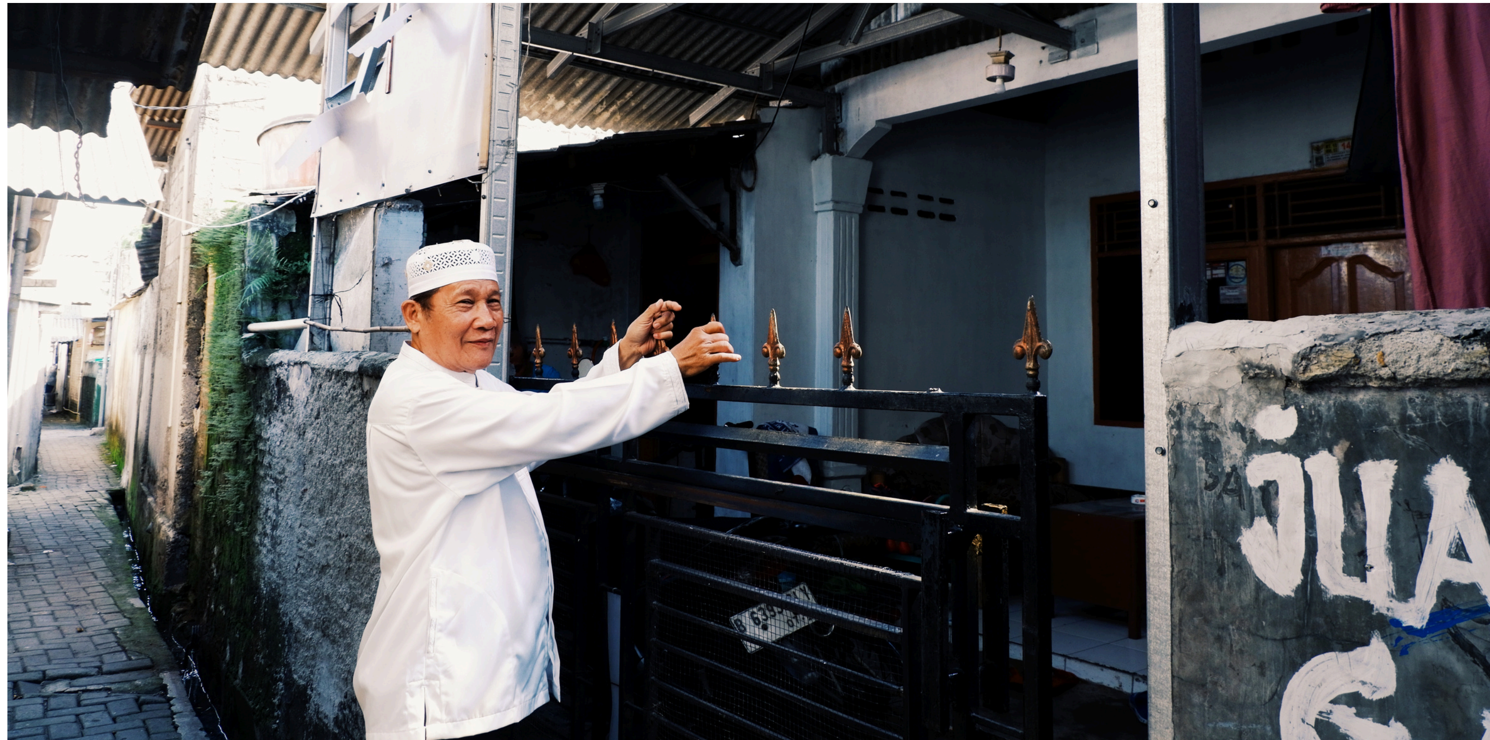
Yang luas sabarnya, yang dalam syukurnya.